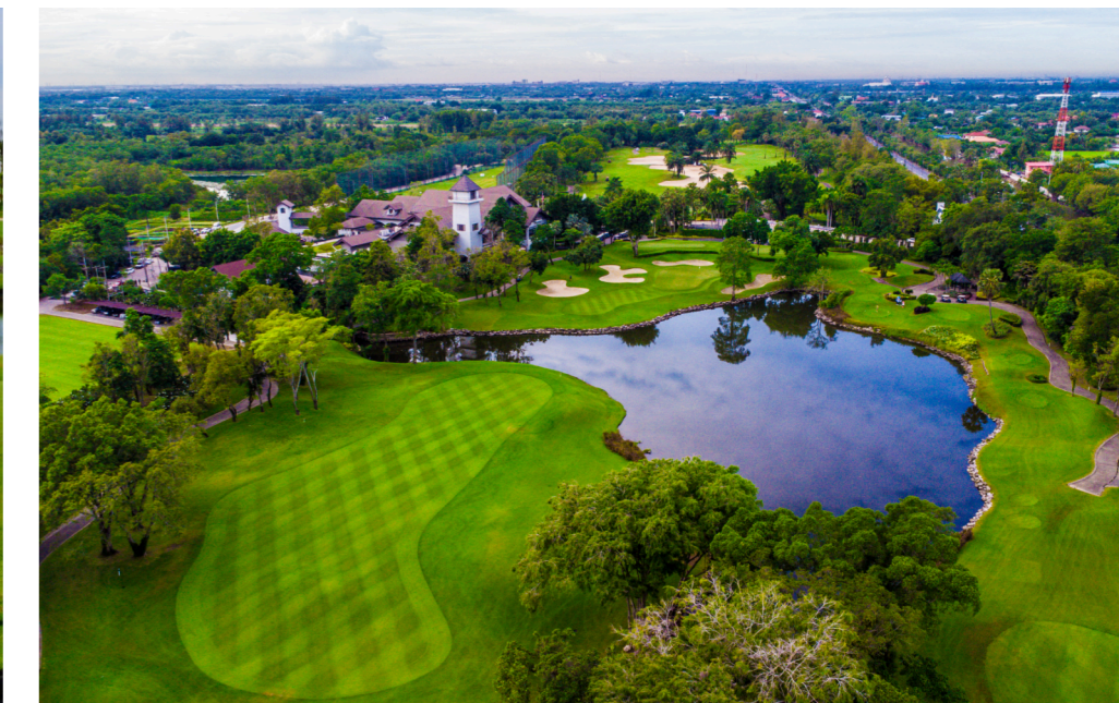
Tag 4 - Alpine Golf & Sports Club