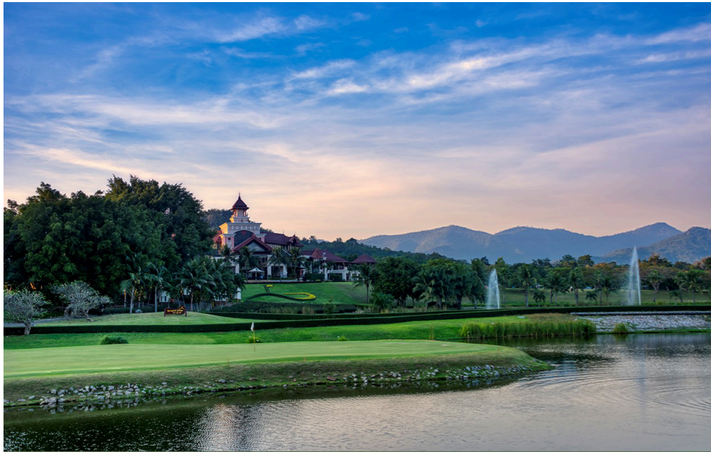
Tag 7 - Springfield Royal Country Club