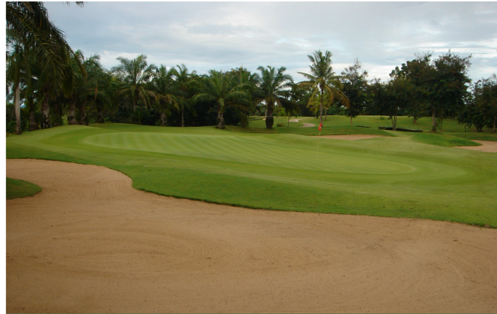
Tag 8 - Majestic Creek Country Club