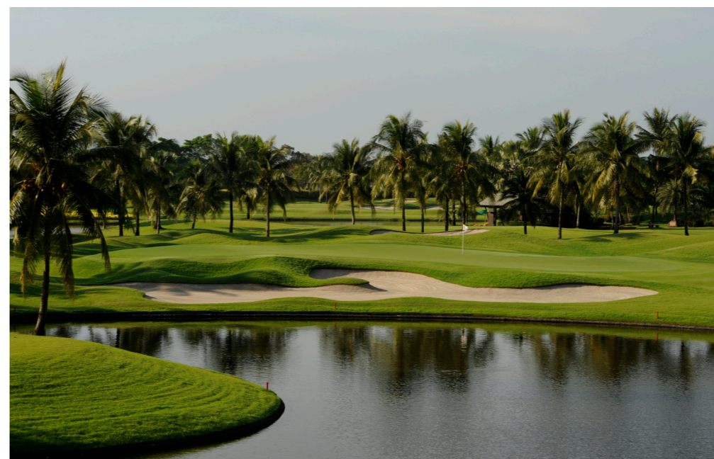
Tag 5 - Thai Country Club