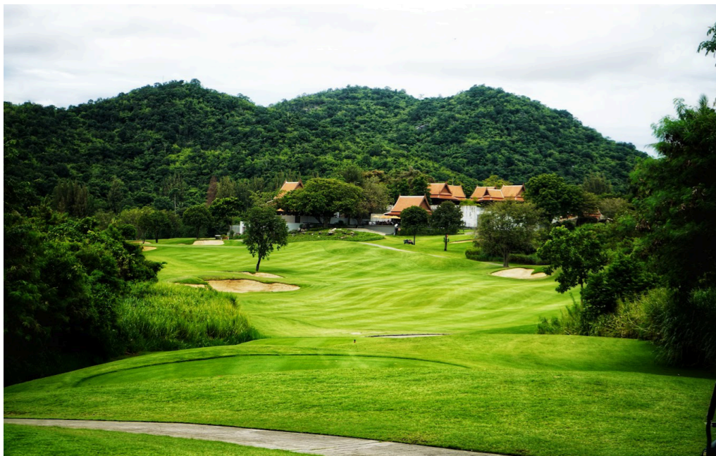
Tag 10 - Pineapple Valley Golf Club Hua Hin