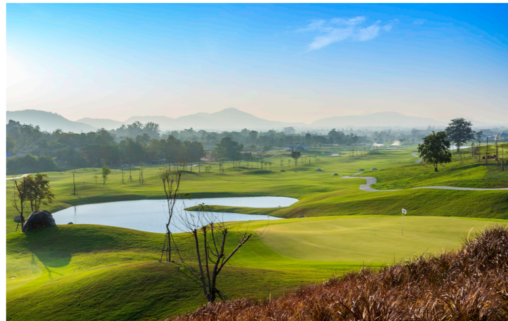
Tag 11 - Black Mountain Golf Club