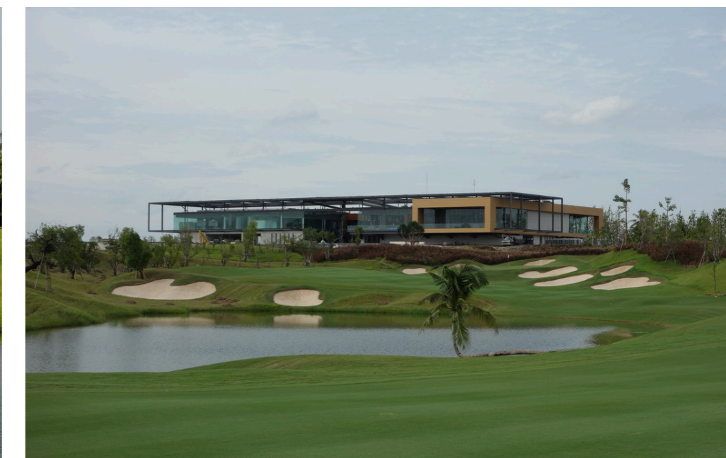
Tag 6 - Nikanti Golf Club