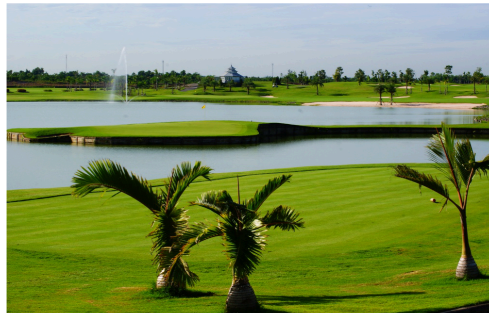
Tag 2 - The Royal Gems Golf City